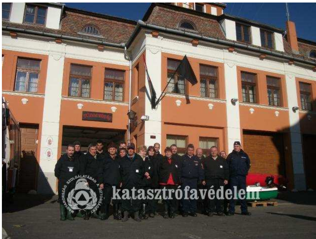
A Tiszazugi Mentőcsoport rendszerbeállítása

A rendszerbeállító gyakorlatot követően egyértelmű célként fogalmazódott meg a Nemzeti Minősítő Gyakorlaton való részvétel és annak sikeres teljesítése. Ennek érdekében a Kirendeltség a mentőcsoport képességeit, személyi és technikai állományát a követelményekhez igazította. A csoport tagjait és technikai eszközeit illetően végrehajtásra került a polgári védelmi kijelölő határozatok kiadása az új jogszabályi háttérnek megfelelő formában.